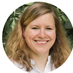
Um artigo de Dörthe

Uma bandeja romântica com motivos de renda e um coração é a opção ideal para transportar as alianças num casamento rústico no campo. Os que quiserem podem ainda estampar as suas iniciais na massa FIMO usando um carimbo. Um cordão de juta fixa as alianças à bandeja, garantindo que não se perdem a caminho do altar. A bandeja fica ainda mais bonita se prendermos ao cordão um pequeno ramo de flores campestres.