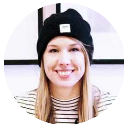
Un article de Vera

Avec ce DIY panneau à clés, ce sera du passé ! Tes clés seront toujours bien rangées de manière pratique mais aussi esthétique.