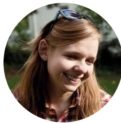
Ein Beitrag von Theresa

Den Urlaub auf Balkonien genießen wir in vollen Zügen, vor allem wenn unsere leckeren Eistee-creations vor Insekten geschützt sind! Die fruchtigen Glasdeckel kann man auch als Untersetzer verwenden und Dank des FIMO effect neon sind sie knallige Farbhighlights in deinem kleinen Dschungel. Wir zeigen dir wie du aus FIMO effect neon pink und FIMO effect neon grün, fruchtige Kiwis, saftige Melonen und sogar exotische Drachenfrüchte herstellen kannst.