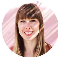
Ein Beitrag von Vera

Wer kennt nicht die hektische Suche nach dem Schlüssel bevor man das Haus verlassen möchte - meist natürlich immer dann, wenn man einen wichtigen Termin hat. Mit diesem DIY Schlüsselbrett hat das Suchen endlich ein Ende und deine Schlüssel sind nicht nur praktisch sondern auch noch hübsch aufbewahrt.