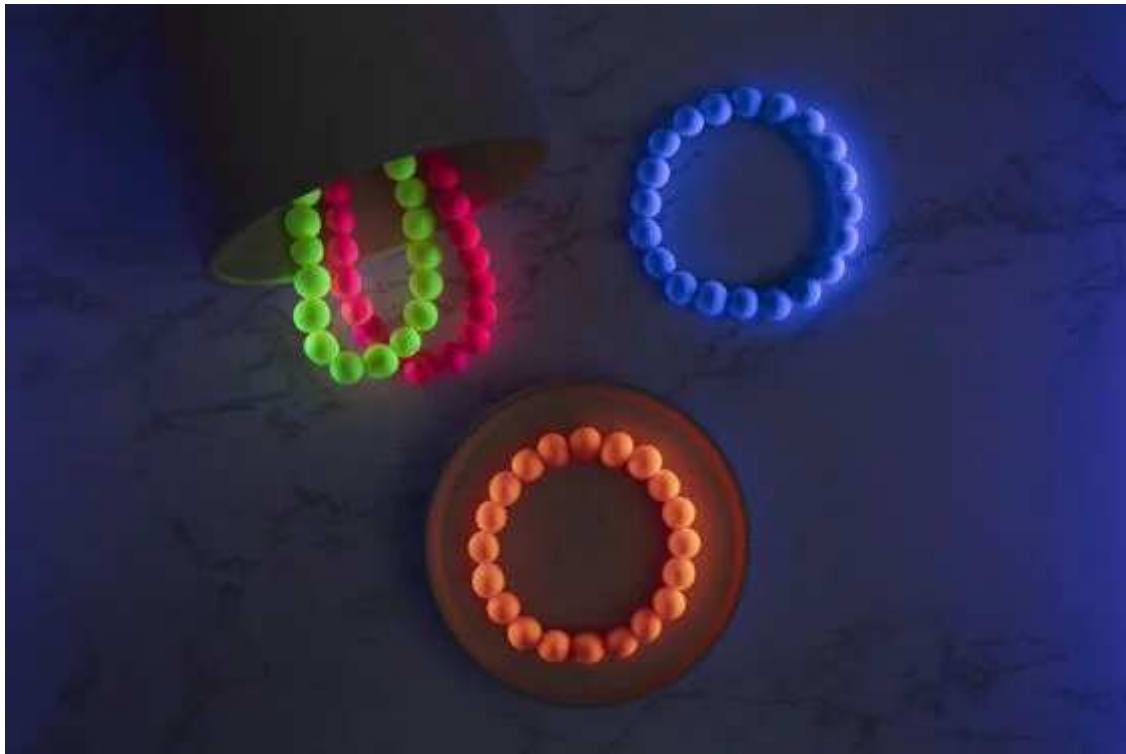
Aperçu du matériel