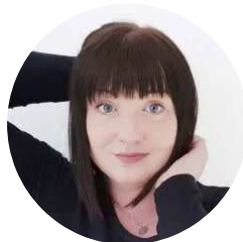
Een bijdrage van Mone

Geef je oude (wijn)flessen een charmant nieuw uiterlijk en maak er een leuke bloemenvaas van in leerlook. Met een omhulsel van FIMO leather-effect wordt je nieuwe oude vaas iets heel bijzonders. Het perfecte upcycling-deco-idee voor een individuele look.